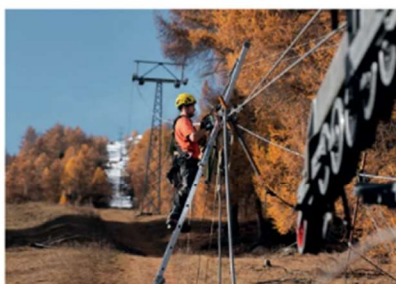
Die Arbeiten sind im Endspurt.

Durch das erreichte Spendenziel von rund einer Million Franken konnten die Sanierungsarbeiten im Sommer dieses Jahres beginnen. Der Törbeltallift ist mit seiner Länge von knapp